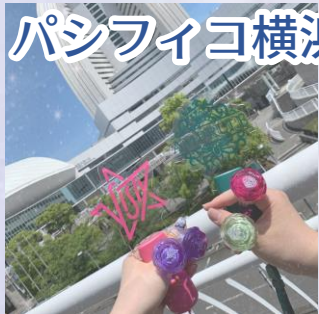
パシフィコ横浜国立大ホール

規模が大きいホールです。ライブイベントだったのですが、ホールだからその距離感やペンライトが綺麗でした。 アリーナやドームとは違ったライブで楽しかったです！とても近かった！！