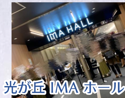
光が丘 IMA ホール

規模が大きいホールです。ライブイベントだったのですが、ホールだからその距離感やペンライトが綺麗でした。 アリーナやドームとは違ったライブで楽しかったです！とても近かった！！