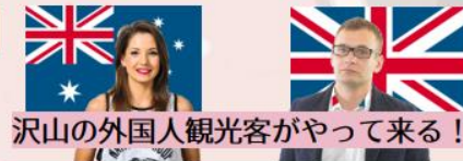
沢山の外国人観光客がやって来る！

漢字の八であることに注目して、外国人と絡めて考えようと思い企画。八つの地域の英語に対応し、漢字の意味も学べるので面白くなったと思います。